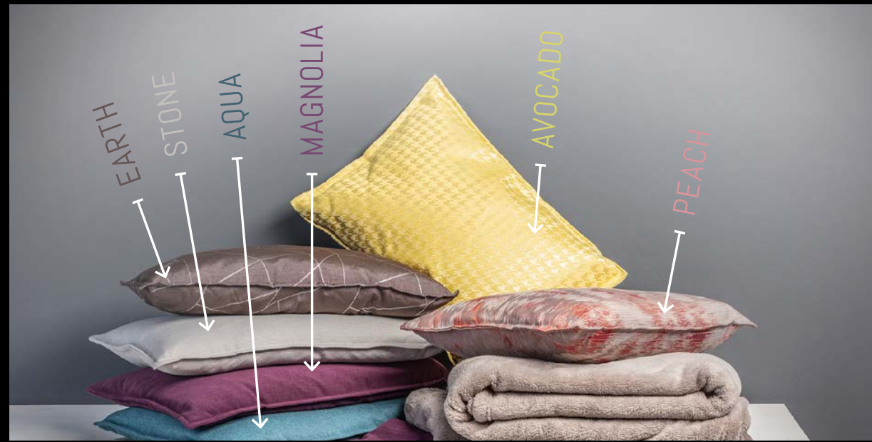
DAS DEKO-PAKET BEINHÄLTET VIER KISSEN, ZWEI KUSCHELDECKEN UND EINE TISCHDECKE. DU KANNST ZWISCHEN 6 FARBEN WÄHLEN. THE "DECO" PACKAGE CONTAINS FOUR CUSHIONS, A SOFT AND CUDDLY BLANKET AND A TABLE CLOTH. YOU CAN SELECT FROM A RANGE OF SIX COLOURS.